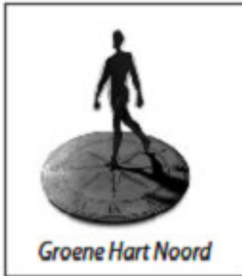
Groene Hart Noord