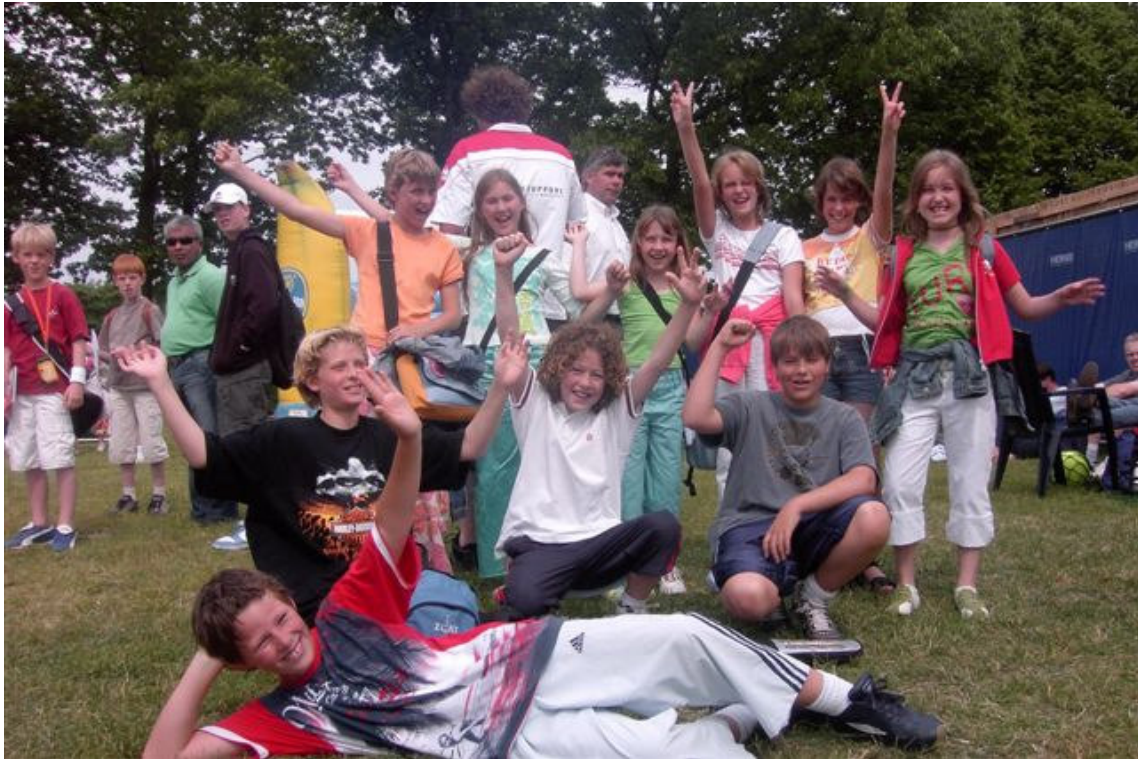
Het was hartstikke gezellig die busreis naar de Ordina Open!